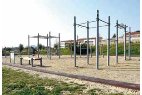
Exemples de structures spécifiques pour la pratique du street workout.

associative, ont décidé d'équiper le parc de la Colombe, dont un diagnostic récent montre la faible fréquentation. Des échanges avec les jeunes, via l'Apase et l'association locale Body sculpt defense (BSD) ont ainsi permis de choisir différentes structures comprenant un module compact et huit agrès disséminés dans l'enceinte du parc. Sur chacun d'entre eux, les utilisateurs trouveront un panneau explicatif et un QR code leur permettant de visualiser sur smartphone des exercices et des enchaînements particuliers. La pratique du street workout à Pont de Claix est prévue en libre accès. Elle s'adresse bien sûr aux particuliers, mais également aux clubs sportifs qui trouveront là une manière de