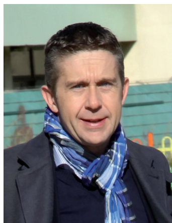
● Christophe Ferrari Maire de Pont de Claix Président de Grenoble-Alpes Métropole