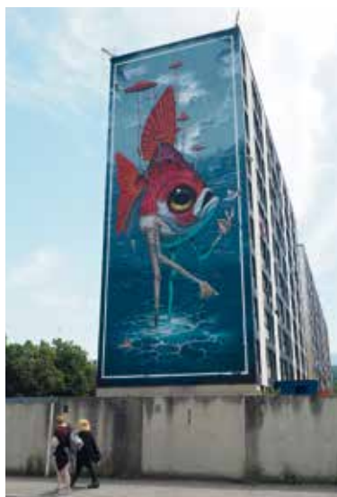
Veks Van Hilik Fresque de 30 mètres sur la façade d'un immeuble de l'Opac38 aux Olympiades

Pour la deuxième année consécutive, Pont de Claix accueille le festival Street Art Fest Grenoble Alpes. Dans ce cadre, trois nouvelles façades d'immeubles et d'édifices offrent au regard de tous des œuvres picturales originales qui transforment de manière colorée et poétique l'environnement urbain.