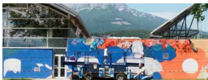
Nesta et Short Fresque réalisée sur 3 façades de Flottibulle