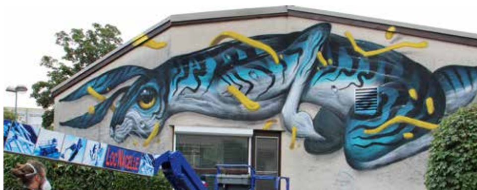
Veks Van Hilik Fresque réalisée sur le mur de la bibliothèque