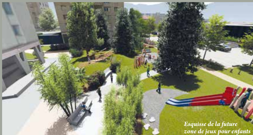
Esquisse de la future zone de jeux pour enfants